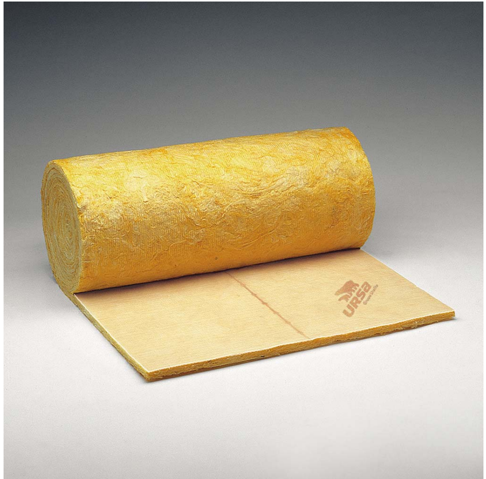
Datum: 21.10.2005

URSA Deutschland GmbH Fuggerstr. 1d 04158 Leipzig Telefon: +49 (0)341 52 11-100 Telefax: +49 (0)341 52 11-109 E-Mail: info@ursa.de