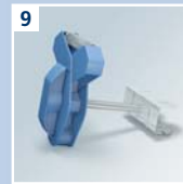
9 URSA CLIPS, patentiert