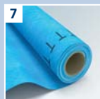
7 URSA SECO PRO 20 Dampfbremse