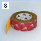
8 URSA SECO PRO KP Haftklebeband