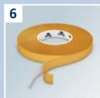
6 URSA CLICK doppel- seitiges Klebeband