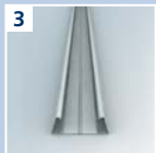
3 URSA CLICK C-Profil