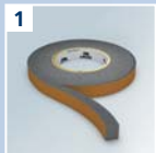
1 URSA CLICK Dichtband