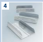
4 URSA CLICK Längs- verbinder C-Profil