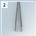
2 URSA CLICK U-Profil